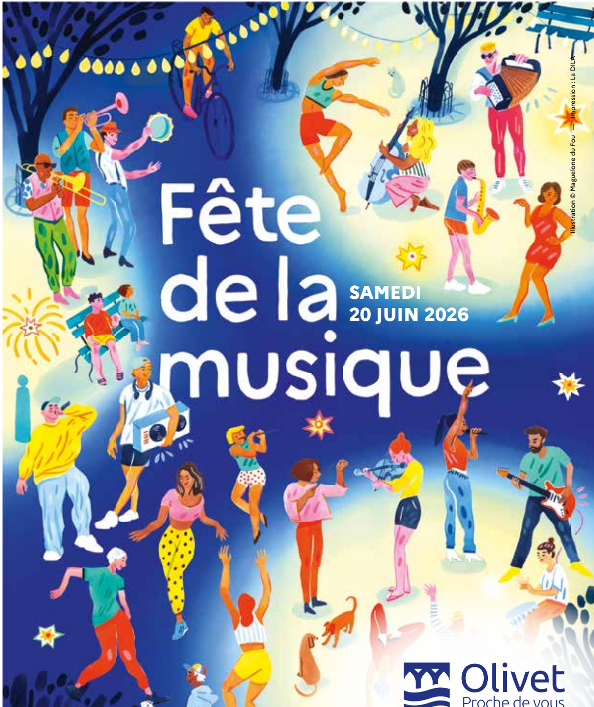
Illustration © Maguelone du Fou — Impression : La DILA