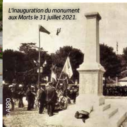
L'inauguration du monument aux Morts le 31 juillet 2021.

du mardi 9 au samedi 13 novembre, de 14h à 18h, à L'Alliage, salle Yvremont.