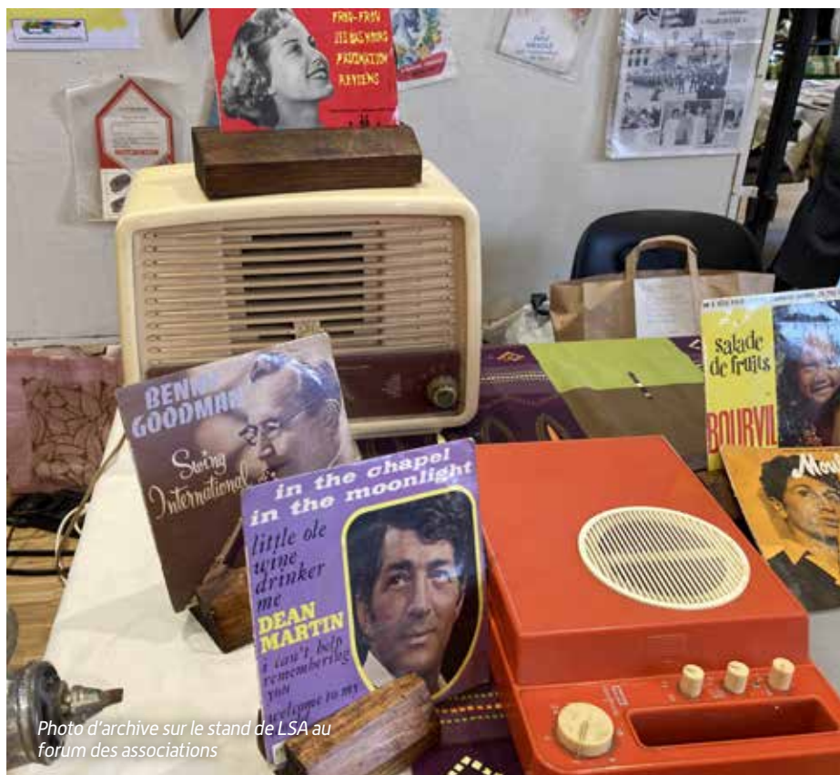
Photo d'archive sur le stand de LSA au forum des associations

Un nouveau projet se prépare avec le concours d'autres associations locales pour mettre en lumière les années 50 et 60 à Olivet. Voitures et costumes d'époque peindront l'Olivet d'autrefois, notamment au moment de la présence américaine d'après-guerre. Sous le signe de la fête et de la bonne humeur, cette plongée dans une ambiance rétro surprendra. Différentes thématiques seront abordées lors de cette journée : il sera possible d'en savoir plus sur les seize années