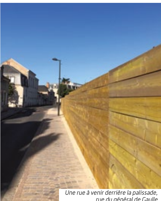
Une rue à venir derrière la palissade, rue du général de Gaulle