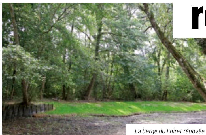
La berge du Loiret rénovée

des pieux d'acacias. En plus de l'engazonnement, des plantes locales de milieu humide, comme des hélophytes, ont été ajoutées, afin de redonner toute sa place à la végétation.