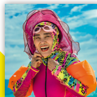
A : Sécurité | B : Écllosion | C : Moyens D : Safari | E : .....